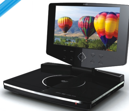
DVD PLAYER PORTABIL

Sunt valabile înscrierile în program până la 10 Noiembrie 2009.