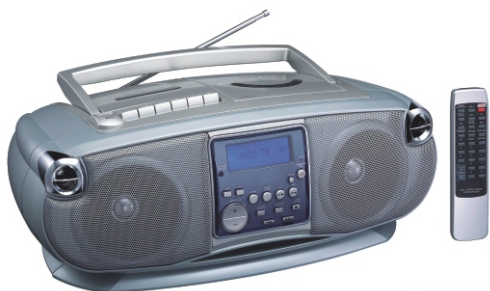
RADIOCASSETOFON CU CD (MP3)