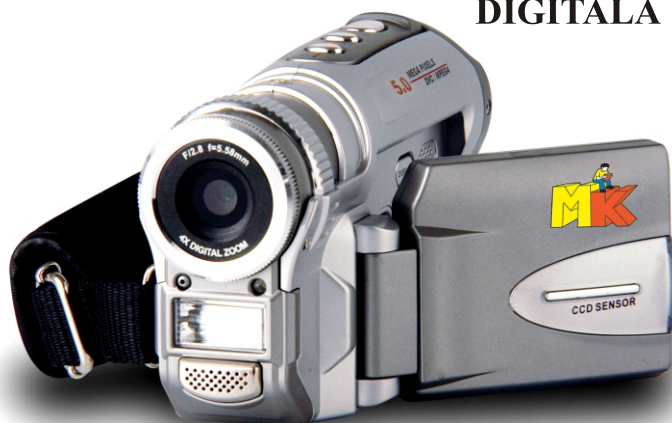
CAMERĂ VIDEO DIGITALĂ