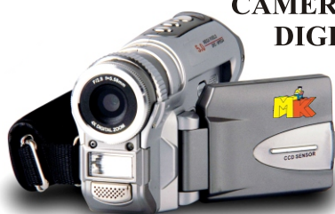
CAMERĂ VIDEO DIGITALĂ