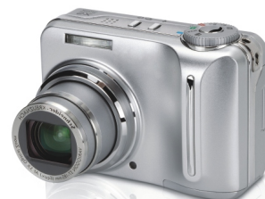
APARAT FOTO DIGITAL