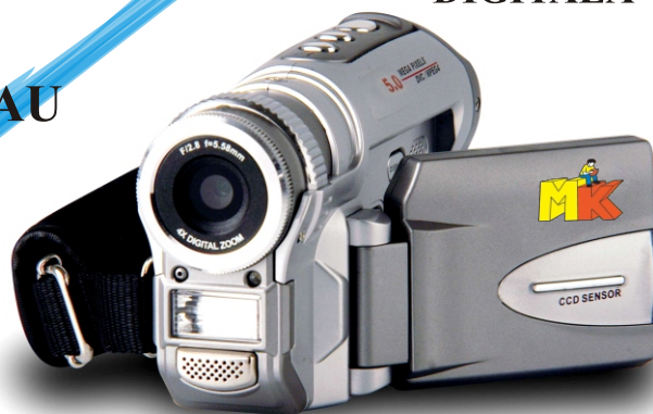
CAMERĂ VIDEO DIGITALĂ