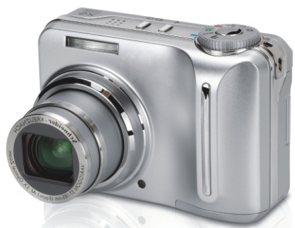
APARAT FOTO DIGITAL